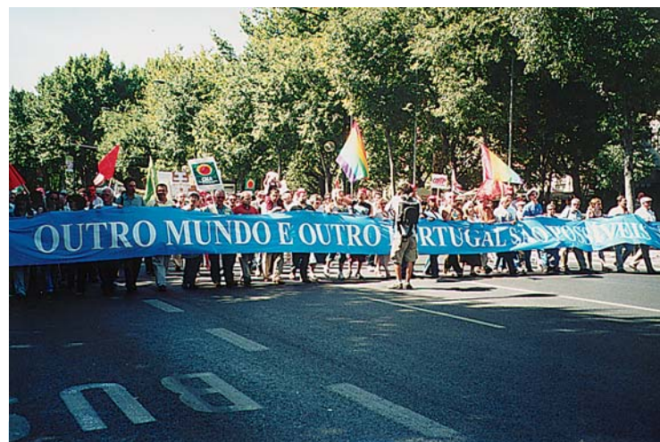
Cabeça do Desfile na Avenida da Liberdade ads Organizações Sociais que estiveram no Fórum Social Português, em Junho de 2003.

O próximo plenário de organizações ficou já agendado para o dia 18 de Fevereiro, no Porto.