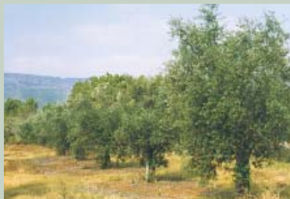
Quadro 4 – Medidas Agro-Ambientais

Além da tardia aprovação do Plano de Desenvolvimento Rural para Portugal Continental (RURIS), a complexidade e elevado número de medidas desta Intervenção (MAA) levou a que a sua aplicação tivesse início apenas em 2001.