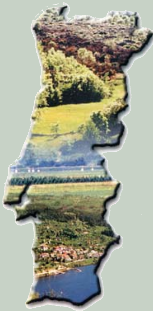
Quadro 6 – Medidas Agro-Ambientais: indicadores de acompanhamento