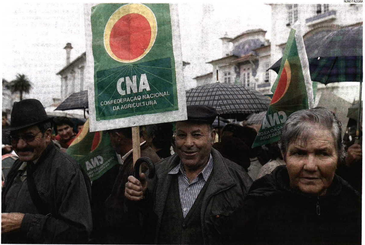
Agricultores que ontem se manifestaram em Aveiro pediram garantias para o escoamento do leite e melhores preços à produção