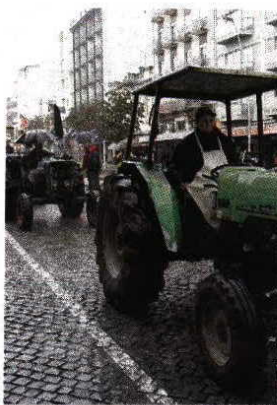
Produtores querem mais ajudas

Uns vieram de autocarro, outros de tractor, em marcha lenta desde Válega (Ovar). O objectivo era comum: chegar a Aveiro para a já habitual manifestação de agricultores, no dia da abertura de mais uma edição da Agrovouga. Vieram alertar para as graves dificuldades do sector agrícola e pedir mais apoios ao Governo, sobretudo no que toca à garantia do escoamento dos produtos e melhores preços de produção.